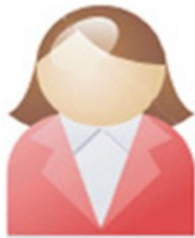
Servidor do Almojarifado